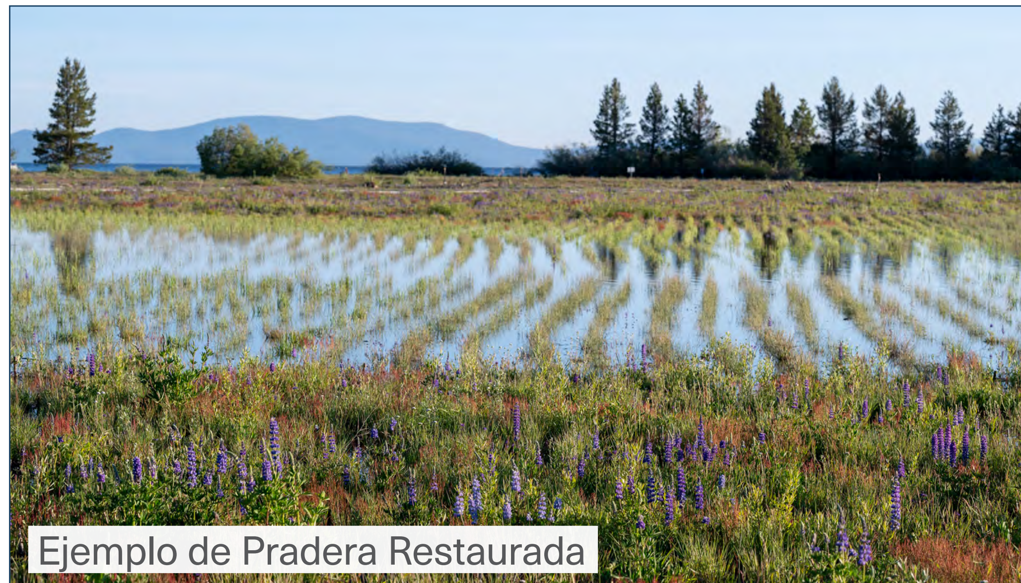
Ejemplo de Pradera Restaurada