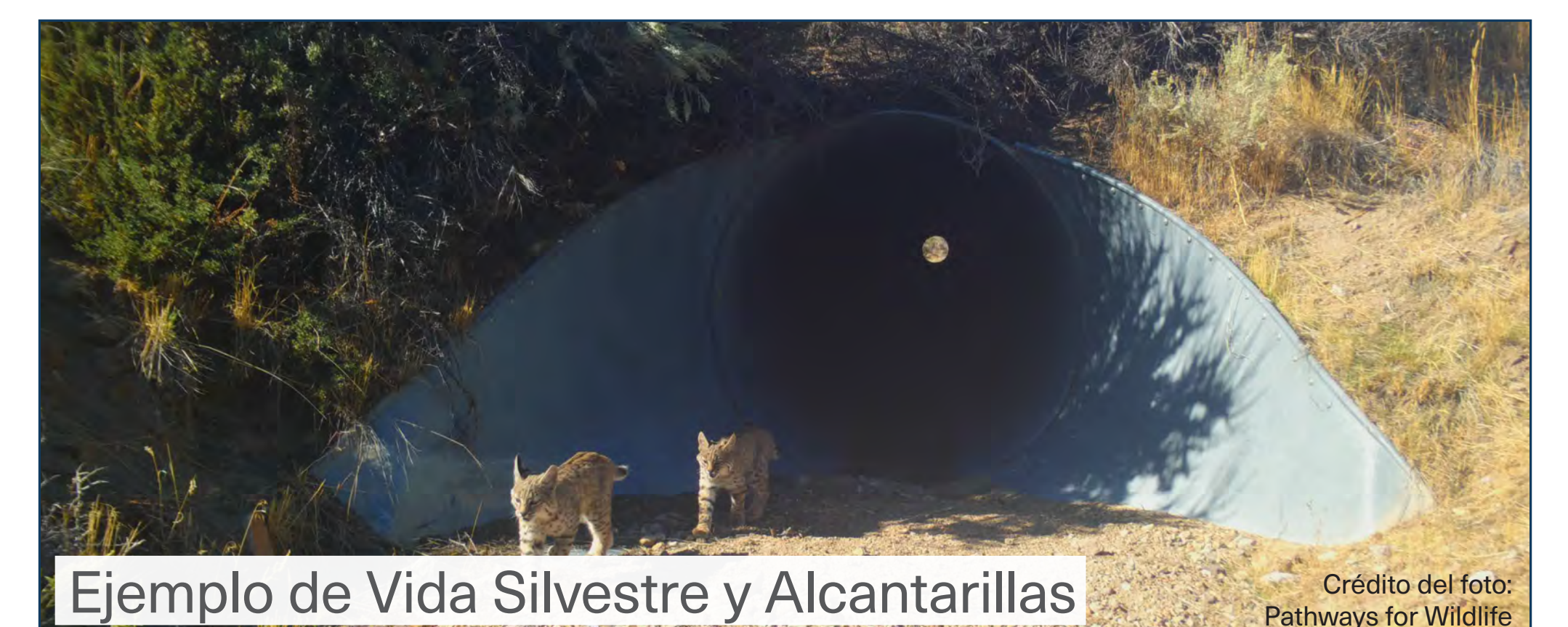
Ejemplo de Vida Silvestre y Alcantarillas