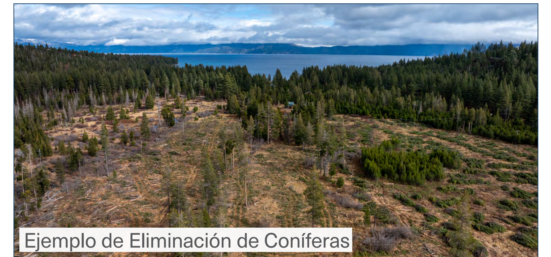
Ejemplo de Eliminación de Coníferas