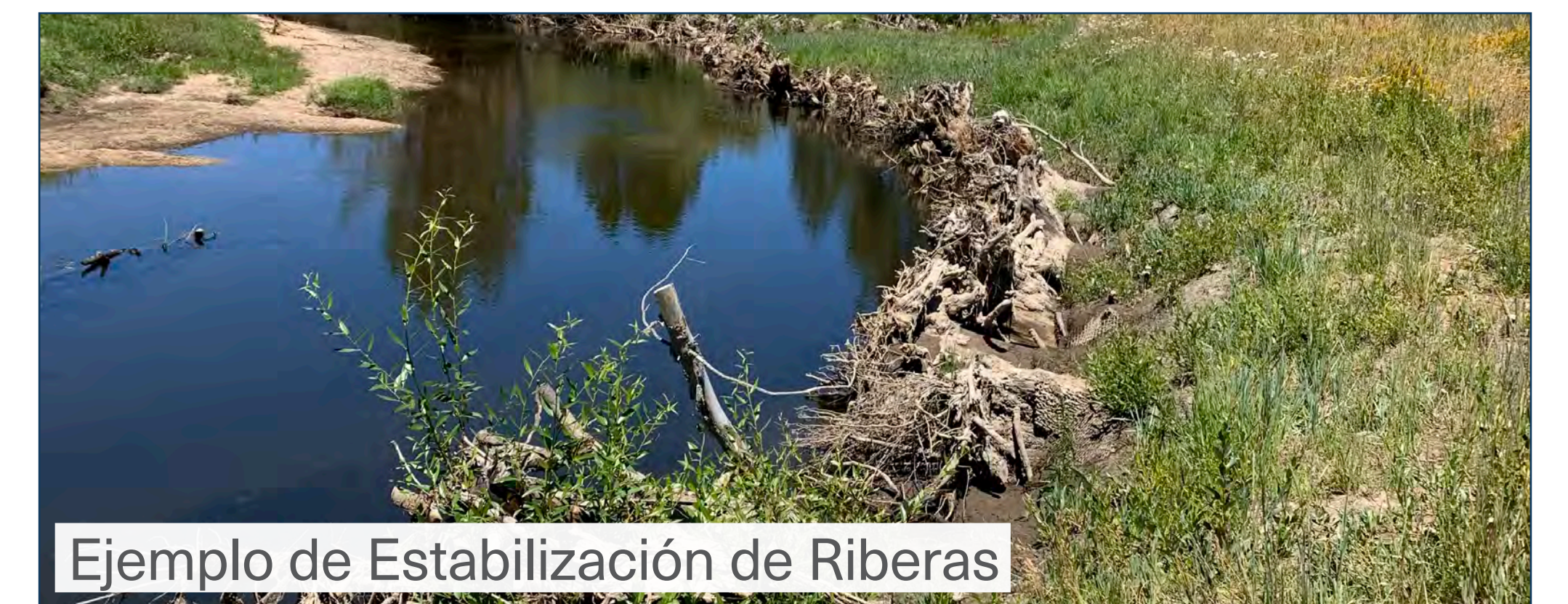
Ejemplo de Estabilización de Riberas