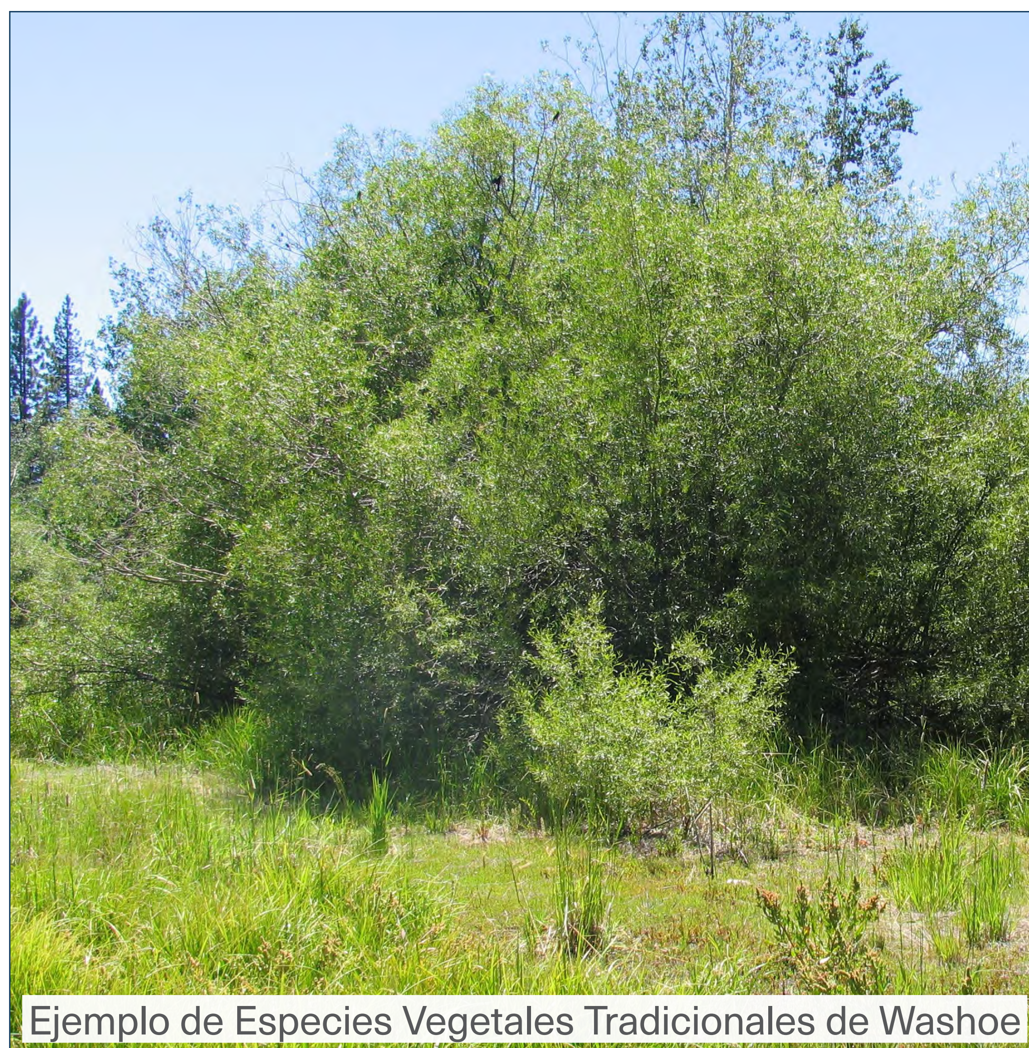
Ejemplo de Especies Vegetales Tradicionales de Washoe